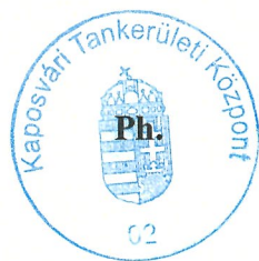
Stickel Péter tankerületi igazgató

Szabályzat érvényessége: 2021. szeptember 1.